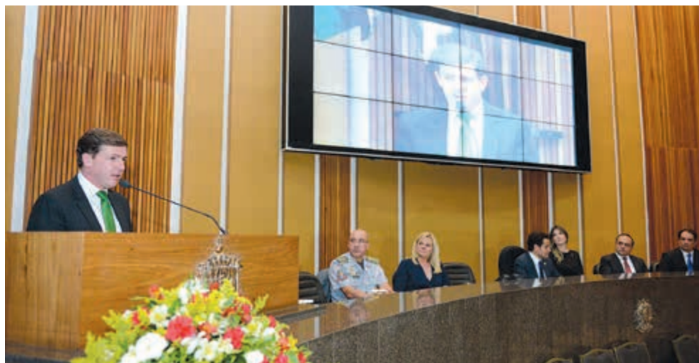
O prefeito Orlando Morando apresentou breve balanço de seus primeiros meses de governo

Os festejos foram formalmente iniciados na terça (01/08), com sessão solene em homenagem ao aniversário da cidade, realizada no plenário lotado, na Câmara. Na oportunidade, o prefeito Orlando Morando apresentou breve balanço de seus primeiros meses de governo. "A sociedade clama por mudanças e o relógio corre contra o governante que quer fazer a diferença. Hoje posso garantir que, após sete meses de gestão, o início dessa longa jornada de trans-